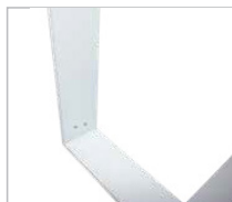
Montage sans outil

Les gabarits d'impression mis à disposition sont fournis à titre indicatif. Ils tiennent compte de procédés internes qui peuvent varier selon vos équipements, matières & finitions. En cas d'impression par vos soins, il vous appartient de tester au préalable la compatibilité de votre media avec le produit avant utilisation.