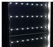
Panneau LED enroulable