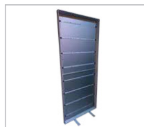
Cadre simple face