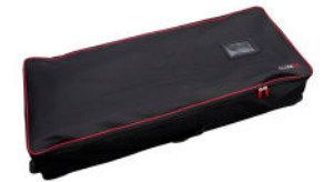
Sac de transport Illumigo 2x1 ILLGO-BAG