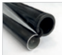
Mât aluminium avec élastique

Les gabarits d'impression mis à disposition sont fournis à titre indicatif. Ils tiennent compte de procédés internes qui peuvent varier selon vos équipements, matières & finitions. En cas d'impression par vos soins, il vous appartient de tester au préalable la compatibilité de votre media avec le produit avant utilisation.