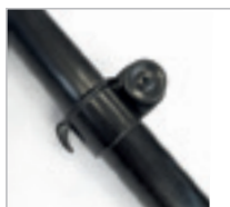
Fixation de la voile avec crochet